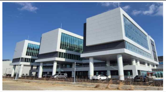
광양만권 소재부품 지식산업센터 주차장