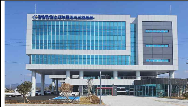
광양만권 소재부품 지식산업센터

○ 행사장소 : 전남 광양시 광양읍 익신산단 3길 40, 광양만권 소재부품 지식산업센터 2층